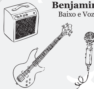
Benjamim Baixo e Voz